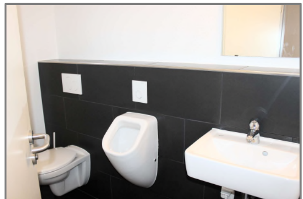
WC - Herren