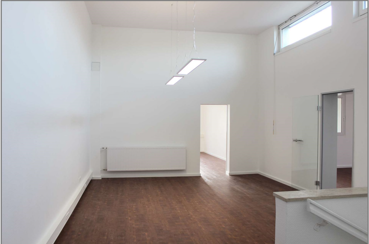
Empfang / Besprechung